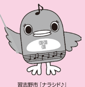
習志野市「ナラシロ」