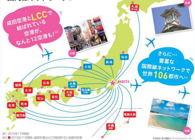
※1 2015年11月現在 ※2 2015年11月現在、成田空港とLCCで結ばれている国内空港