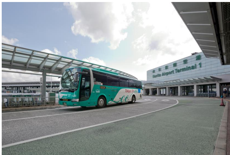
『東京シャトル (Tokyo Shuttle)』の運行車両

京成グループの京成バス（本社：千葉県市川市、社長：齋藤 隆）、成田空港交通（本社：千葉県成田市、社長：佐藤 克己）、京成バスシステム（本社：千葉県船橋市、社長：青木 良憲）、リムジン・パッセンジャーサービス（本社：東京都中央区、社長：高梨 純）では、東京都心と成田空港を結ぶ高速バス『東京シャトル (Tokyo Shuttle)』のお客様累計300万人達成を記念して、「東京シャトルお客様ご利用“3”00万人達成キャンペーン」を実施いたします。