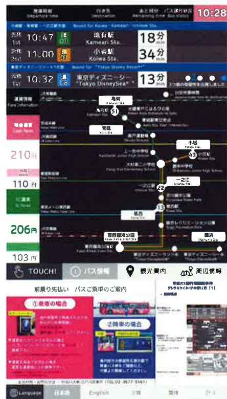
画面表示イメージ

これは、訪日外国人旅行者を含むすべてのお客様に安心してバスに乗車していただく目的で、日本電気株式会社（NEC）と共同開発し設置したものです。