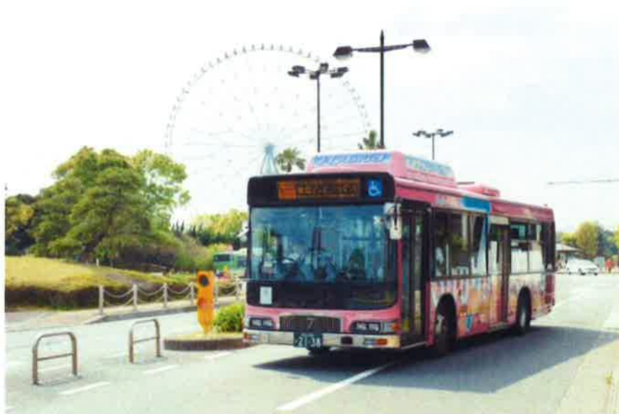
葛西臨海公園周辺を走る環七シャトル

環七シャトルバス「シャトル☆セブン」は、国および江戸川区の支援を得て、江戸川区シャトルバス導入調査委員会からの委託を受けて2007年4月1日に実証運行を開始し、2009年4月1日に本格運行へ移行しました。