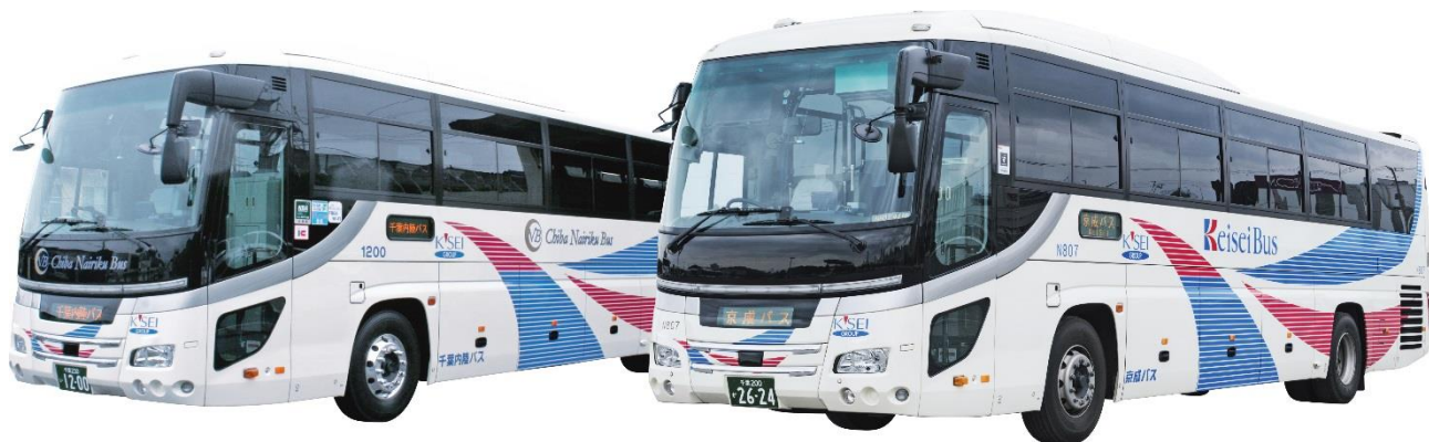
「千葉成田線」で使用する車両 (一例 左:千葉内陸バス 右:京成バス)

千葉内陸バス及び京成バスでは、今後も成田空港アクセスの利便性向上に取り組んで参ります。